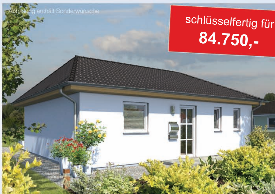
Abbildung enthält Sonderwünsche

Nettogrundfläche: ca. 78 m 2 Wohnfläche nach WoFIV: ca. 78 m 2